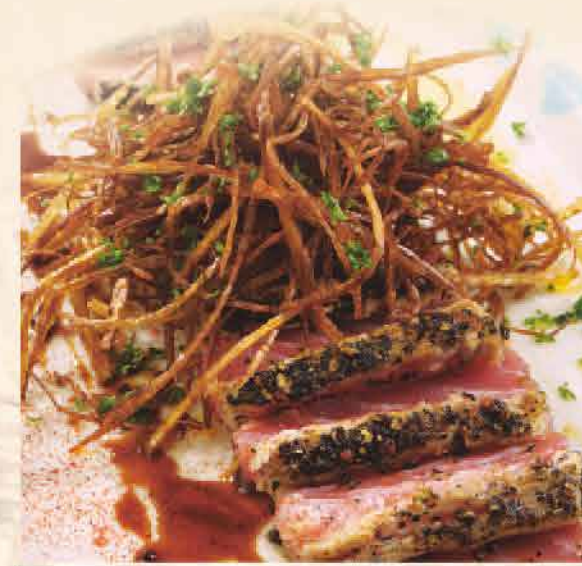
STEAK DE TUNA