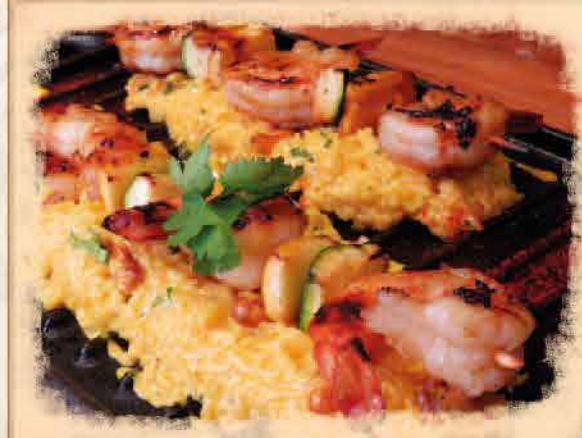
BROCHETAS DE LANGOSTINOS AL JOSPER