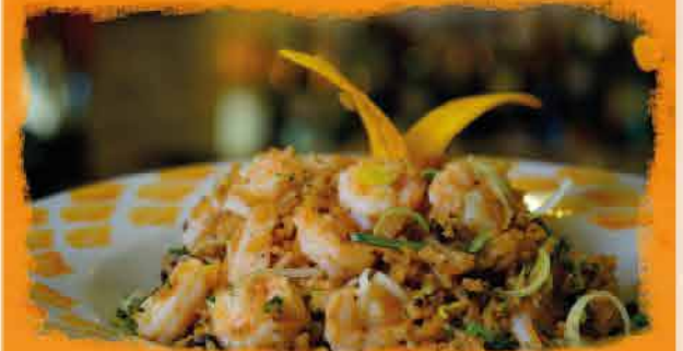
CREMOSO DE COCO Y CAMARÓN