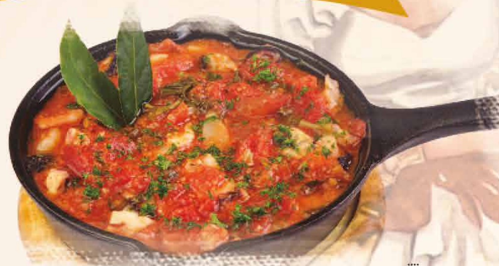
CALDERILLO DE MARISCOS